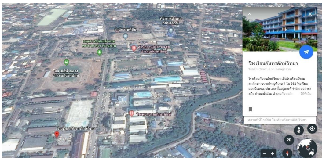
ภาพแสดงภาพถ่ายทางดาวเทียมของโรงเรียนกันทรลักษ์วิทยา

ที่ตั้ง เลขที่ 443 หมู่ที่ 5 ถนนดำรงสถิต ตำบลน้ำอ้อม อำเภอกันทรลักษ์ จังหวัดศรีสะเกษ รหัสไปรษณีย์ 33110 สังกัดสำนักงานเขตพื้นที่การศึกษามัธยมศึกษาศรีสะเกษ ยโสธร โทรศัพท 045-661617 โทรสาร 045-661420 email: klws@klws.ac.th website : www.klws.ac.th